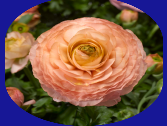
Pink & Peach